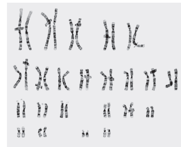
Normaler weiblicher Chromosomensatz

Wenn wir bei Ihnen eine spezifische Ursache für eine Fehlgeburtstneigung feststellen, können wir gegebenenfalls eine Therapieempfehlung geben, die das Risiko für weitere Fehlgeburten reduziert.